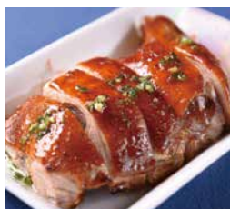
玫瑰油雞 Roasted Chicken with Soy Sauce