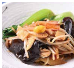
羅漢燴上素 (素食) Stewed Assorted Seasonal Vegetables