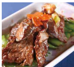
蠔油牛肉 Stir-Fried Beef with Oyster Sauce