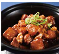
鹹魚雞粒豆腐 Braised Tofu with Chicken and Salted Fish