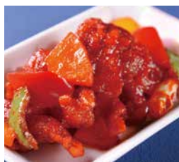
糖醋咕嚕肉 Pork Fillets with Sweet and Sour Sauce